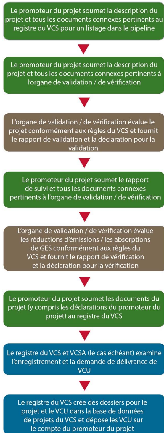
Diagramme 2 : Cycle de vie et processus d'enregistrement d'un projet