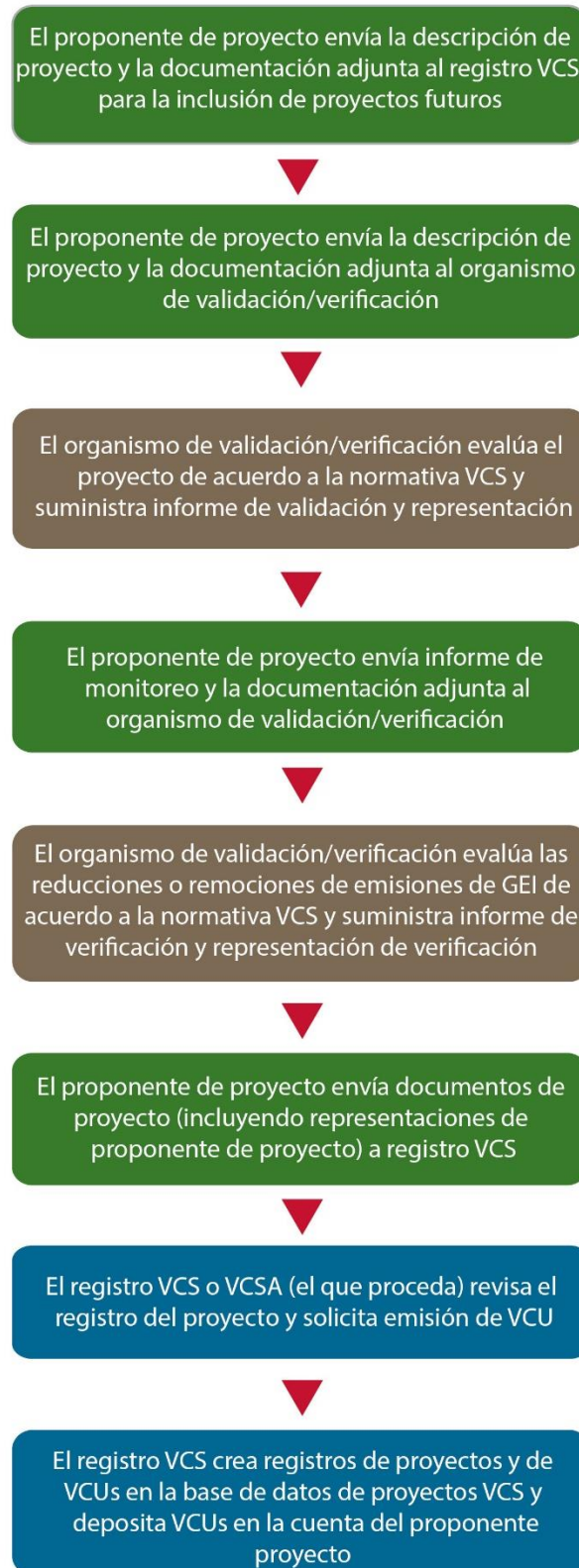
Diagrama 2: Ciclo de Vida del Proyecto y Proceso de Registro